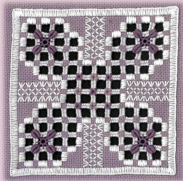
実寸 約9×9 (cm)