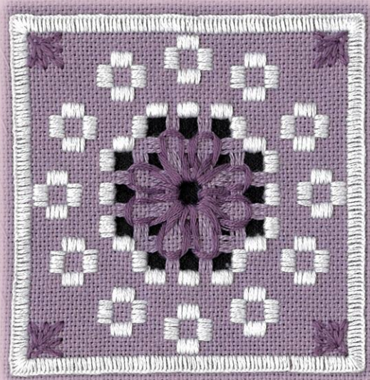
実寸 約8×8 (cm)