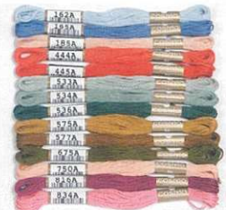
No.162A・165A・ 185A・444A・ 445A・533A・ 534A・536A・ 575A・577A・ 675A・750A・ 816A・834A

従来の糸から色合いが変わったリニューアル糸 14 色セット。それぞれ微妙な色合いの変化ですが、今回のリニューアルにより、それぞれのグラデーションがなめらかに美しく変化するようになりました。