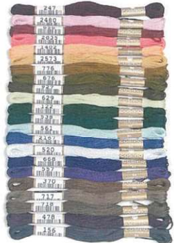
No.247・248・656・ 2835・1402・2573・ 776・676・927・629・ 122・538・561・2167・ 520・668・557・370・ 717・718・478・156

63 色の新色が加わったコスモ 25 番刺しゅう糸。より豊かで深みのある色彩表現が可能となりました。ぜひ新しい、美しい色の新色糸のセットをこの機会にお揃えいただき、作品制作に活かしていただけたらと思います。