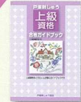
▲上級ガイドブック (上級作品 A)