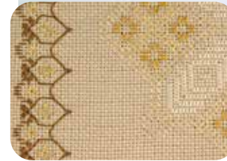
●本体サイズ：約 34×74cm ●刺しゅう部分サイズ：約 29×67.5cm ●本体素材：綿 100%(ジャバクロス #3800) ●本体・レースカラー：キャメル ●キット内容：テーブルセンター・25番糸・針・刺し方解説書 ★ご注意：糸は各色 1束ずつ入りですが、不足分は別途お買い足し下さい。

別染めレースで縁取られたテーブルセンターとランチョンマットは刺しゅうを刺すだけで良いので、初心者の方にもおすすめです。こちらを使用した、かんたんな地刺しのキットをご用意しました。