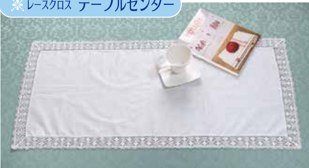
●本体サイズ：約 40×90cm 商品番号 08107179 税込 ¥3,080 (本体価格 ¥2,800)