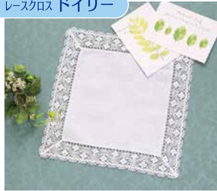
●本体サイズ：約 30×30cm 商品番号 08107177 税込 ¥1,430 (本体価格 ¥1,300)