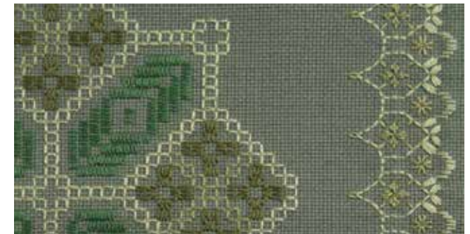
●布サイズ：約 100×45cm 仕上がりサイズ：約 87×33cm ●本体素材：綿 100%(ジャバクロス #65100) ●本体カラー：ダークグリーン ●キット内容：刺しゅう布・25番刺しゅう糸・針・解説書 ★ご注意：糸は各色 2束ずつ入りですが、不足分は別途お買い足し下さい。

シックな配色が魅力のテーブルセンター。細かい目のジャバクロス #65100 にステッチして、テーブルセンターに仕立てます。刺しゅうはやさしいステッチでできるので、初心者の方にもおすすめです。