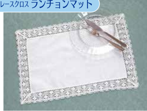
●本体サイズ：約 30×45cm 商品番号 08107178 税込 ¥1,980 (本体価格 ¥1,800)