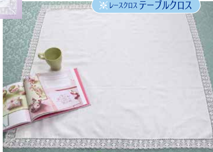
●本体サイズ：約 90×90cm 商品番号 08107181 税込 ¥4,950 (本体価格 ¥4,500)

広幅のレースで縁取られた綿麻のクロス類。ドイリーからテーブルクロスまで、各種のクロスが揃いました。刺しゅうをするだけで仕上がるのがうれしいポイントです。また、セット使いで刺しゅうを楽しむのもおすすめです。カラーはすべてオフホワイトとなります。