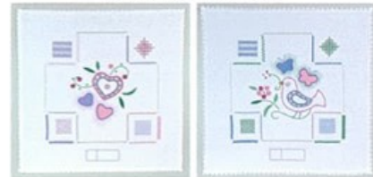
▲中級の課題作品 (B・C)

初級・中級資格課題作品を全10回で学ぶ集中クラス「初級・中級チャレンジクラス」は大変好評をいただき、多くの方が資格を取得されています。ご自宅でもしっかり予習・復習をいただける『初級・中級資格合格ガイドブック』をテキストとし、カリキュラムをもとに刺しゅう布の基礎から正しいステッチの刺し方やポイントをしっかり学び、技術を身に付ける資格認定を目指すクラスです。10回のうち2回を補講日としておりますので、お休みされた場合の振替や制作途中での疑問・質問にもしっかりとお答えしていきます。使用する刺しゅう布は100番(麻)または8000番(綿)です。図案を転写し、ふちをレース処理した布をご用意しておりますので、ぜひご利用ください。