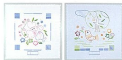
▲初級の課題作品 (B・C)