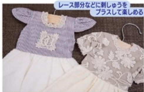
レース部分などに刺しゅうをプラスして楽しめる