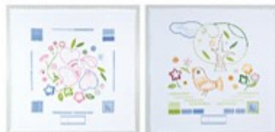
▲初級の課題作品 (B・C)