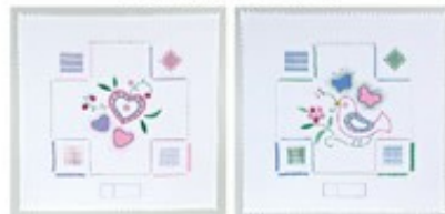
▲中級の課題作品 (B・C)

初級・中級資格課題作品を全10回で学ぶ集中クラス「初級・中級チャレンジクラス」は大変好評をいただき、多くの方が資格を取得されています。ご自宅でもしっかり予習・復習をいただける「初級・中級資格合格ガイドブック」をテキストとし、カリキュラムをもとに刺しゅう布の基礎から正しいステッチの刺し方やポイントをしっかり学び、技術を身に付ける資格認定を目指すクラスです。10回のうち2回を補講日としておりますので、お休みされた場合の振替や制作途中での疑問・質問にもしっかりとお答えしていきます。使用する刺しゅう布は100番(麻)または8000番(綿)です。図案を転写し、ふちをレース処理した布もご用意しておりますので、ぜひご活用ください。