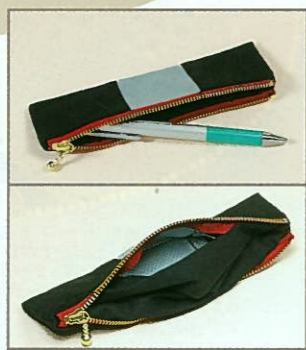
▲刺しゅうは裏地を外に引き出すようにしてスッチします。