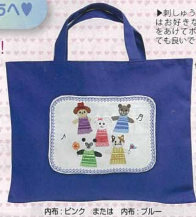
内布：ピンク または 内布：ブルー