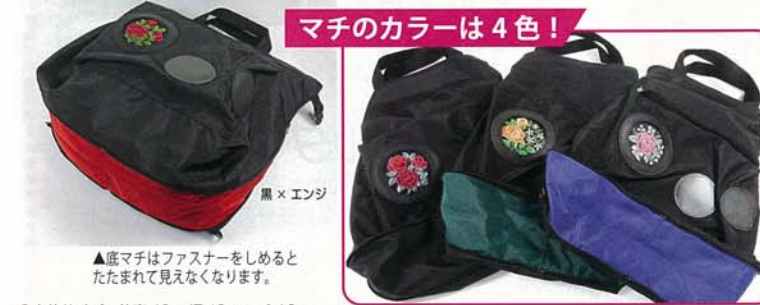
▲底マチはファスナーをしめるとたたまれて見えなくなります。