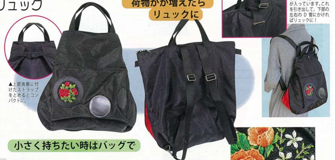
▲上部両側に付けたストラップをとめるとコンパクトに

しわナイロン製の軽いバッグは、アイデアがいっぱい! 小さく持ちたい時は上部左右のストラップで袋口を狭くしてとめて持つ。荷物が増えたら、側面から底に続くファスナーをあけて、マチを作って持つ。上部のストラップもはずせばさらに大きなものも収納可。そして、後ろ上部にあるポケットからベルトを引き出して、下部の D 管にひっかければ、便利なリュックに変身です! 刺しゅうは前ポケットにある円形の窓に差し込んで両面テープでセットします。旅行などにも大活躍しそうなおすすめのバッグです。